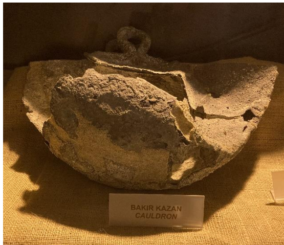
Zinn-, Kasteron (Kalderon-)-Barren mit Ladehaken, Schiffsladung aus vorchristlicher Zeit, Zypern 04-2024

Das erforderliche Zinn für die Bronzelegierung wurde nach jüdischen Quellen aus Kasteron (Cornwall, Devon, Galicien) per Schiff angeliefert 5 .