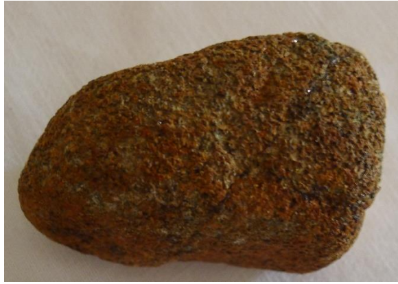
Kupfergestein aus einer Abraumhalde, Zypern 04-2024

Das erforderliche Zinn für die Bronzelegierung wurde nach jüdischen Quellen aus Kasteron (Cornwall, Devon, Galicien) per Schiff angeliefert 5 .