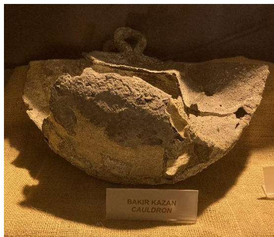
Zinn-, Kasteron (Kalderon-)-Barren mit Ladehaken, Schiffsladung aus vorchristlicher Zeit, Zypern 04-2024

Das erforderliche Zinn für die Bronzelegierung wurde nach jüdischen Quellen aus Kasteron (Cornwall, Devon, Galicien) per Schiff angeliefert 5 .